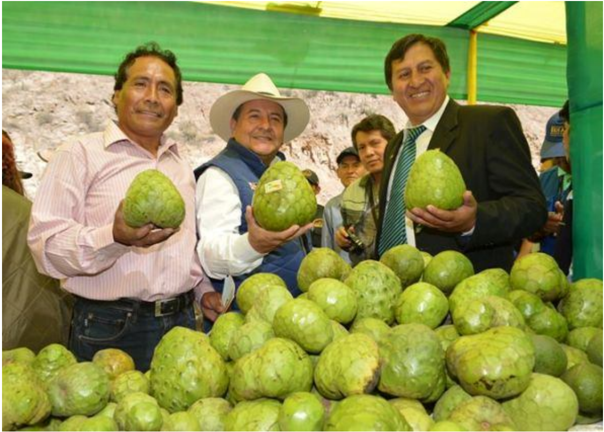
Producto bandera del Distrito de San Mateo de Otao