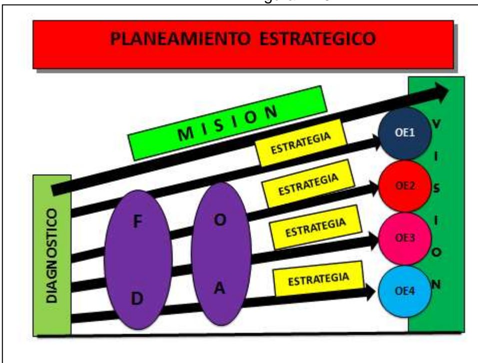
Figura N° 02

Las competencias y funciones específicas municipales se cumplen en armonía con las políticas y planes nacionales, regionales y locales de desarrollo.