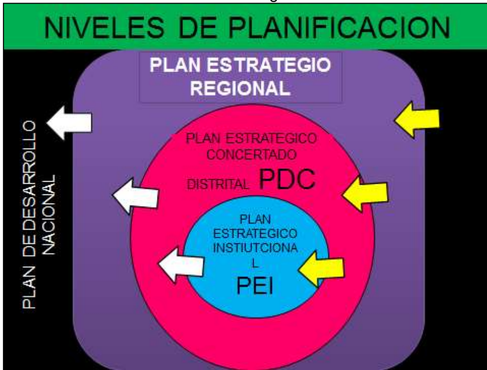
Figura N° 03

Los gobiernos locales promueven el desarrollo integral, para viabilizar el crecimiento económico, la justicia social y la sostenibilidad ambiental. La promoción del desarrollo local es permanente e integral. Las municipalidades provinciales y distritales promueven el desarrollo local, en coordinación y asociación con los niveles de gobierno regional y nacional, con el objeto de facilitar la competitividad local y propiciar las mejores condiciones de vida de su población.