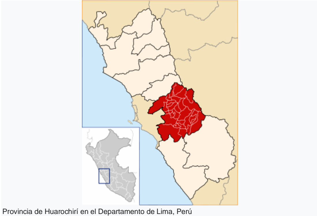
Provincia de Huarochirí en el Departamento de Lima, Perú