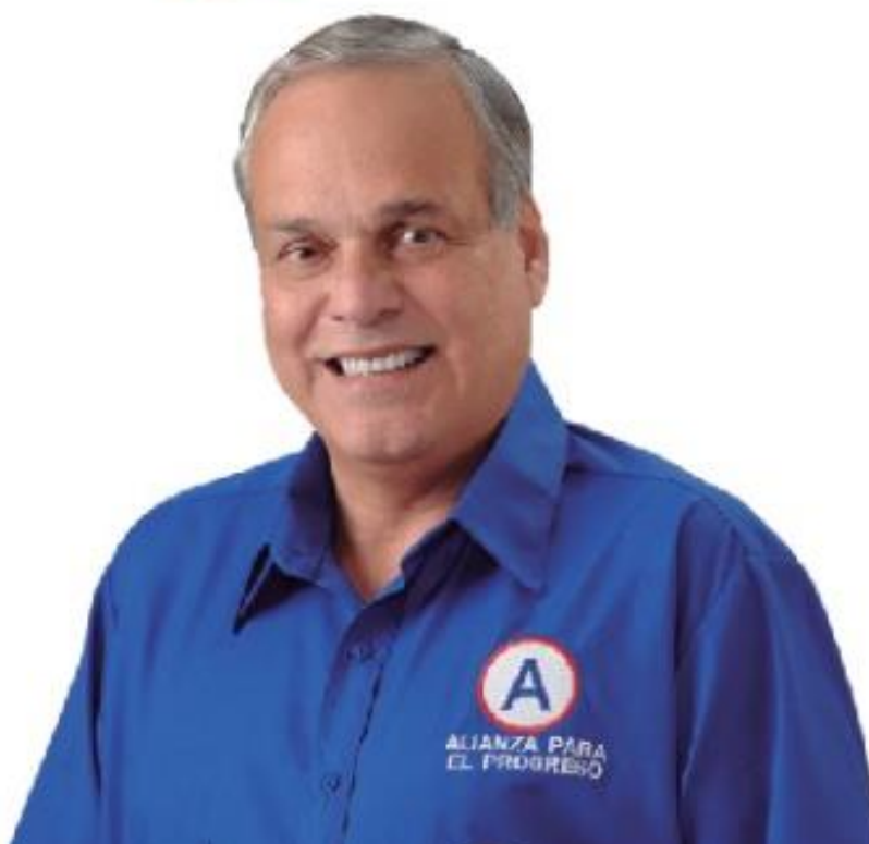
Rafael Antonio Aita Campodónico Alcalde Provincial de Chiclayo