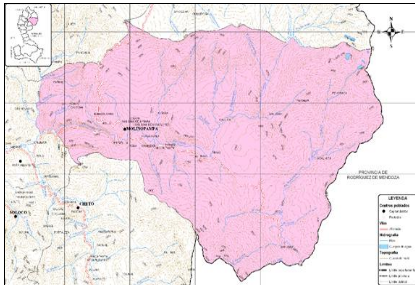
DISTRITO DE LA JALCA